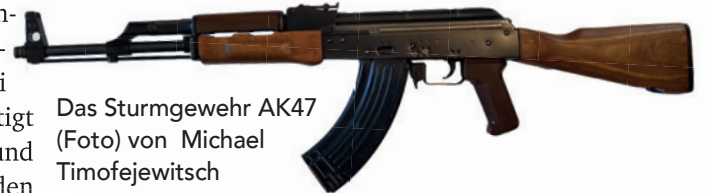
Das Sturmgewehr AK47 (Foto) von Michael Timofejewitsch

beschaffung war die Wieger im weiteren Verlauf auch für den Export bestimmt. Die Gewehre zeichneten sich durch hohe