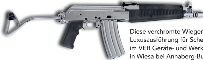
Diese verchromte Wieger wurde als Luxusausführung für Scheichs in Arabien im VEB Geräte- und Werkzeugbau in Wiesa bei Annaberg-Buchholz im Erzgebirge produziert.

Fertigungsqualität aus, die mit computer-gesteuerten Maschinen realisiert werden konnte. Die Sonderausstellung wird am 4. September 2020, 11 Uhr eröffnet.